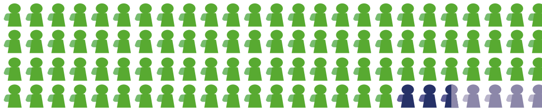
AANTAL LEERLINGEN (TOTAAL 1.565.214)

BASISONDERWIJS (93,2%) SPECIAAL BASISONDERWIJS (2,3%) (VOORTGEZET) SPECIAAL ONDERWIJS (4,5%)