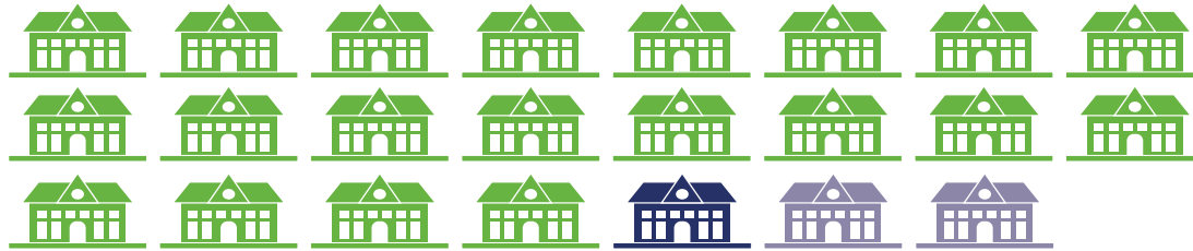
AANTAL SCHOLEN (TOTAAL 7.772)

BASSISCHOLEN (6.706) SPECIAAL BASISONDERWIJS (304) (VOORTGEZET) SPECIAAL ONDERWIJS (762)